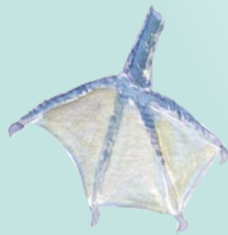
Detall de la pota del corb marí