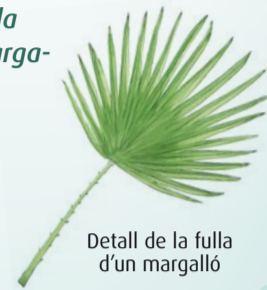
Detall de la fulla d'un margalló